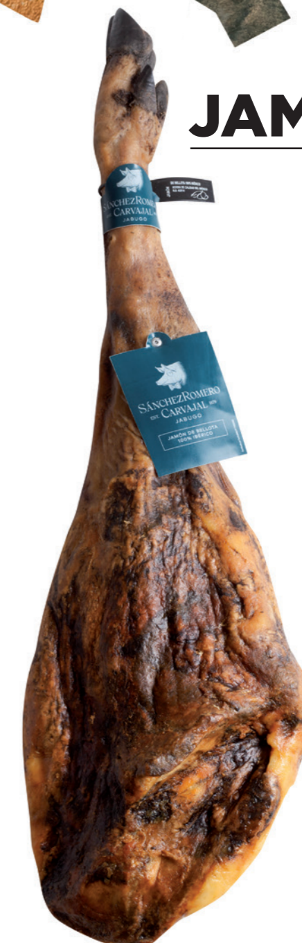
Jamón Ibérico 100 % Bellota Sanchez Romero Carvajal 62,40€/ Kg 36 meses de curación Pieza de 7- 8 kg.