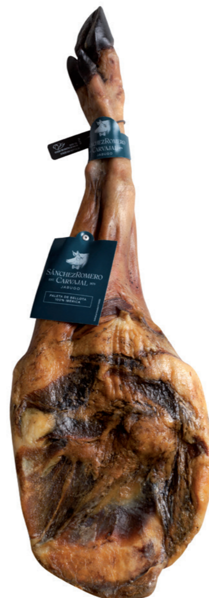
Paleta de Jamón Ibérico 100% Bellota Sanchez Romero Carvajal 29,7€/ Kg 36 meses de curación Pieza de 5- 6 kg.