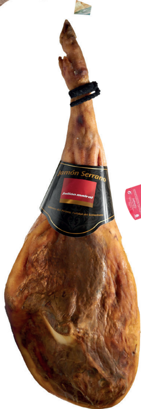
Jamón Reserva 50% Duroc Mairal 9,40 €/ kg 18 meses de curación Pieza de 7- 7,5 kg.