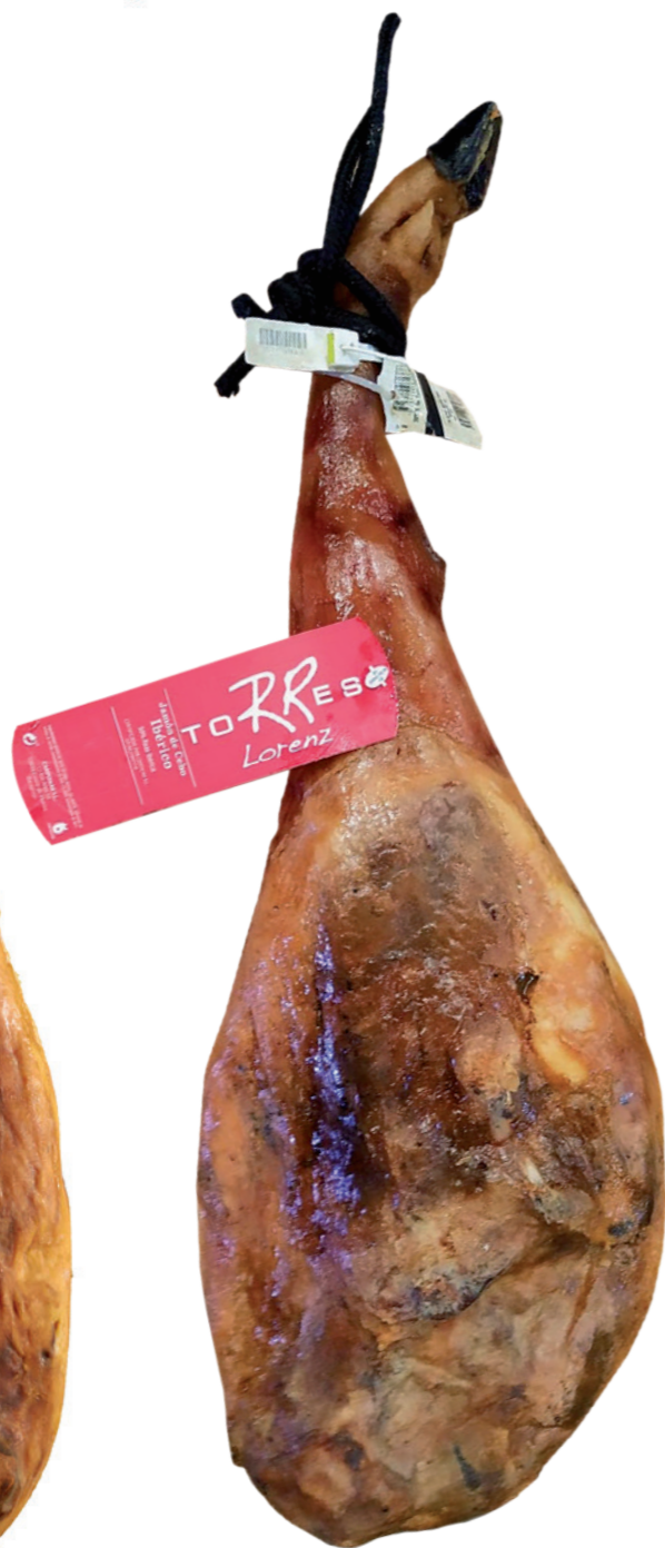
Jamón Ibérico de Cebo Torres "brida blanca" 9,40 €/ kg 18 meses de curación Pieza de 7-8 kg.