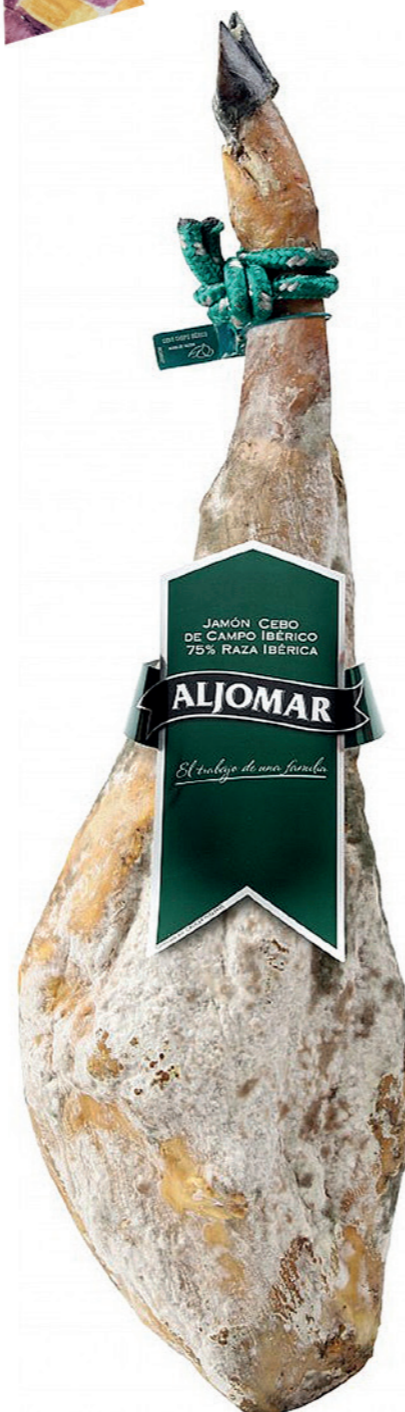
Jamón Ibérico de campo Aljomar "etiqueta verde" 21,80 €/ Kg 36 meses de curación Pieza de 7- 8 kg.